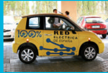
Vehículo eléctrico de Red Eléctrica de España

Para mejorar la eficiencia del sistema eléctrico es muy importante que la demanda eléctrica se desplace hacia las horas de menor consumo; y es ahí donde la recarga lenta nocturna del coche eléctrico puede jugar un papel fundamental en el aplanamiento de la curva de demanda.