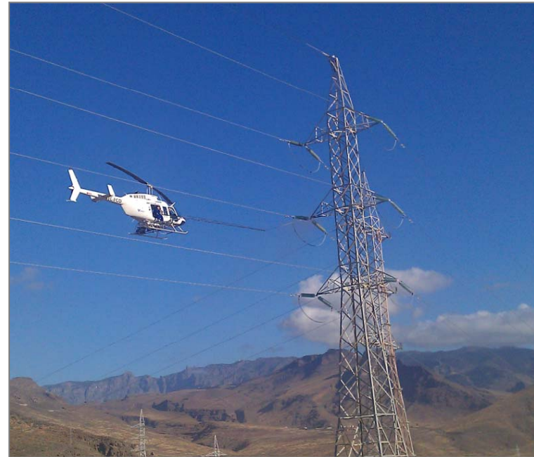
Limpeza de cadenas de aisladores con camión y helicóptero en Gran Canaria.