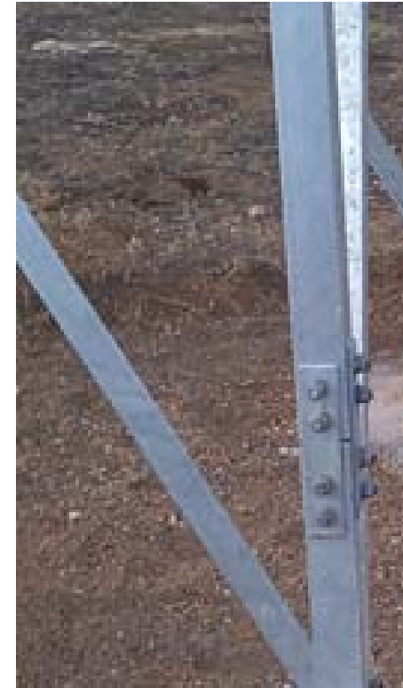
Sustitución de apoyos en Lanzarote.