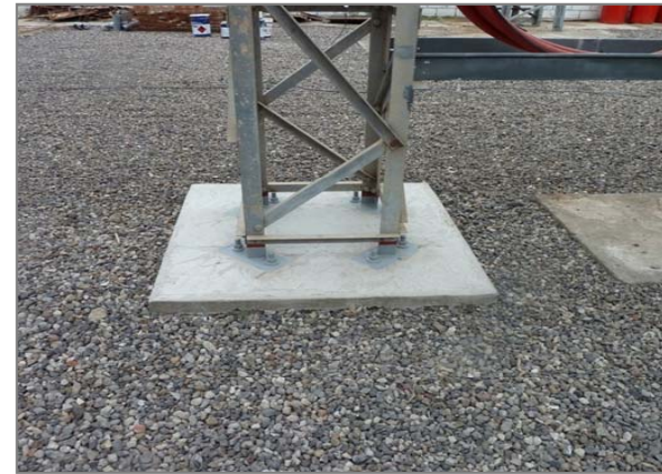
Saneamiento de las bases de los pórticos.