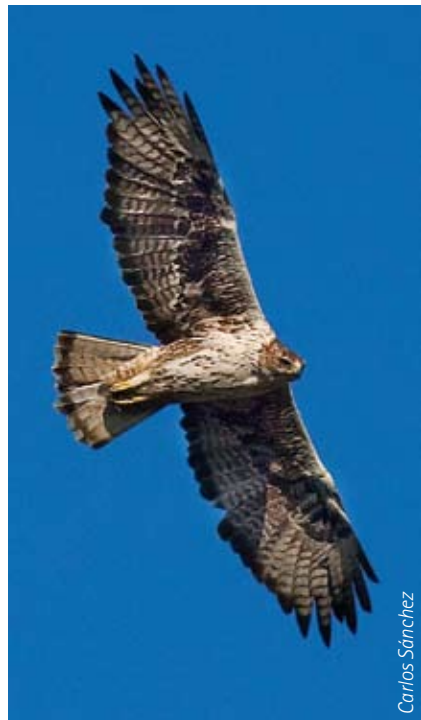
Adult en vol. Es pot observar la banda terminal de la coa, que li dóna nom.

És una espècie caracteritzada per tenir una edat de reproducció tardana (comença als 3-4 anys), una baixa fecunditat i una supervivència adulta elevada.