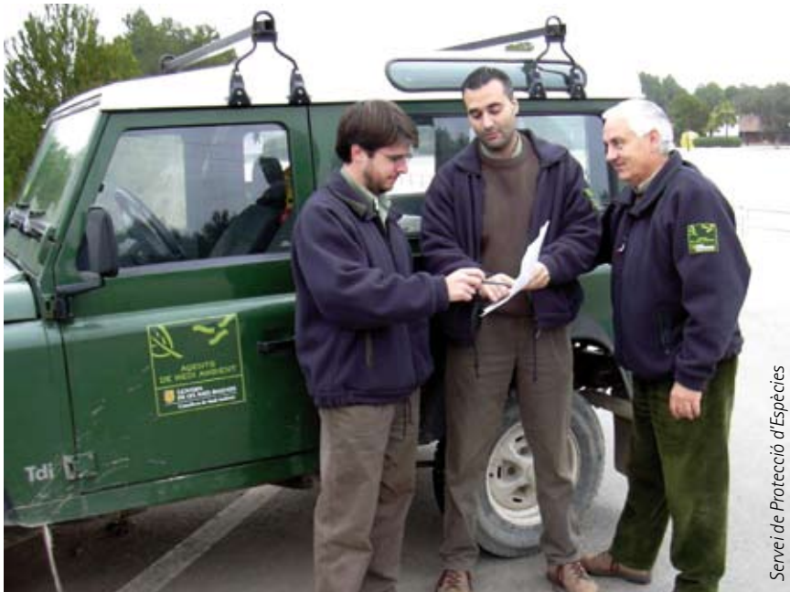
Servei de Protecció d'Espècies

Per dur endavant un pla de reintroducció de qualsevol animal o planta, hi ha uns preceptes a tenir en compte: són els criteris de la Unió Internacional per a la Conservació de la Naturalesa (UICN) per a reintroduccions. Diuen que primer han d'haver desaparegut les causes que van extingir l'espècie i que les condicions de la natura han d'esser adients per allotjar-la.