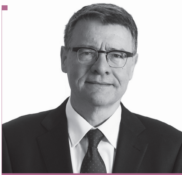
Jordi Sevilla Presidente del Grupo Red Eléctrica