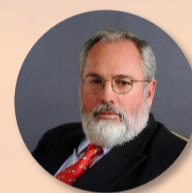
D. Miguel Arias Cañete Comisario de Energía, Comisión Europea