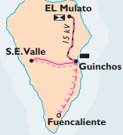
La Palma Island

Installations programmed, under construction or in service on 31 ST december 2010